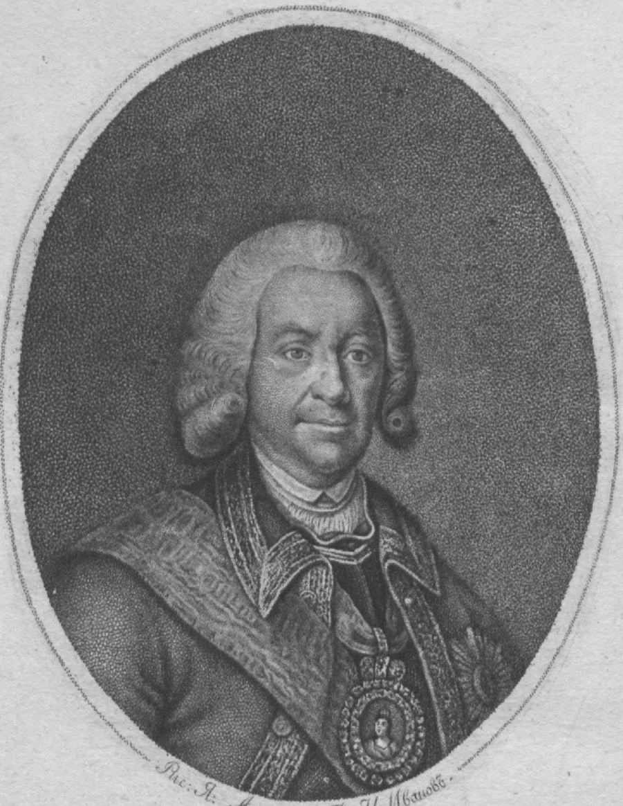
Рис. Я. Арцимовъ. Гра. И. Мвановъ.