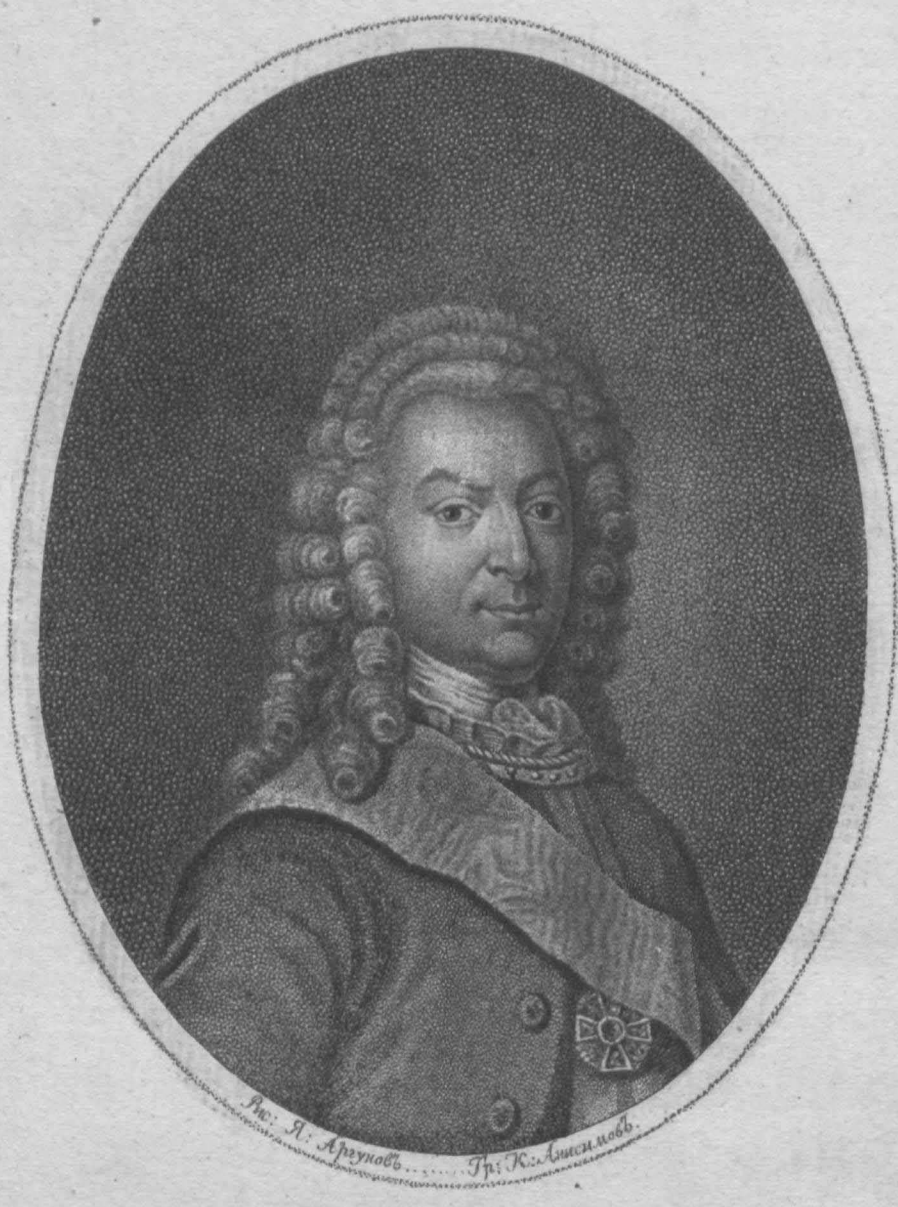
Рис. Я. Арсеньевъ..... Грав. К. Анисимовъ.

Графъ Григорій Петровичъ Сереньшевъ, Генералъ Аншескѣ и Сенаторъ.