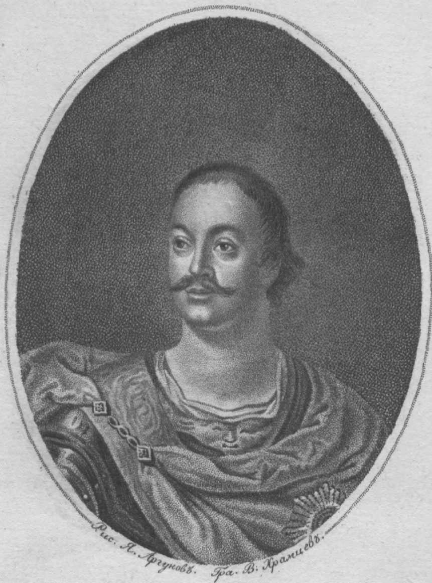
Иванъ Ивановичъ Бутурлинъ, Генералъ Артилеріи и Гвардіи Преображенскаго полку Подполковникъ.