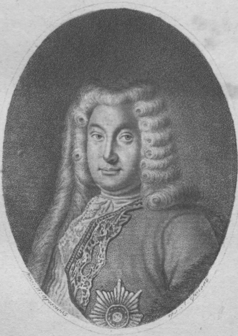
Франко Андрей Ивановичъ Остерманъ, Ваще - Канцлеръ, а потомъ Генералъ Адмиралъ.